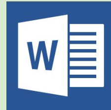
Microsoft Office Word